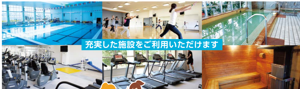
充実した施設をご利用いただけます

3月・4月・5月 3ヶ月限定価格 5,280円 ※1ヶ月分体験料 春のキャンペーン体験後 ご入会でプレゼント 入会金 0円 + 先着30名様限定 ギフトカード 3,000円分 登録料なし 誰でも参加OK 高校生以上参加OK ※フロントにて申し込み手続きをお願いいたします ※定員に達した場合、入場をお断りする場合があります ※スイムレッスンは週1回となります(振替可) ※過去6ヶ月以内に退会された方はキャンペーン対象外